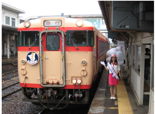
キハ48形リバイバルちどり(三次駅)

2013年は、安芸矢口企画活動地域内で2つの大きな出来事がありました。一つは「広島デステイネーションキャンペーン」の一環で行われた、芸備線での「リバイバルトレイン 急行ちどり」の運行です。キハ48形2両に、国鉄急行色のラッピングを施して、8月・9月の4日間、広島〜三次間を1日1往復しました。座席指定券は全便で完売し、久々に沿線で撮り鉄の活動が目立つなど、沿線と鉄道趣味界隈に大きな盛り上がりをもたらしました。